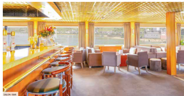
SALON / BAR